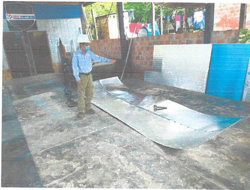
Fotografía N° 03.- Residente de Obra verificando los trabajos de confección de la chalupa de aluminio de 16 pies de lora.