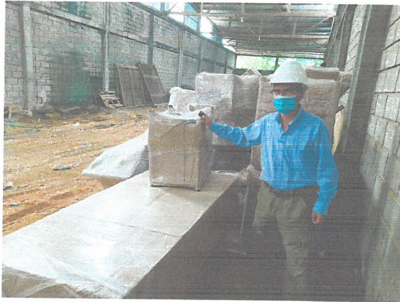
Fotografía N° 01.- Residente de Obra verificando el equipamiento, que se acopia en el almacén de la Empresa.